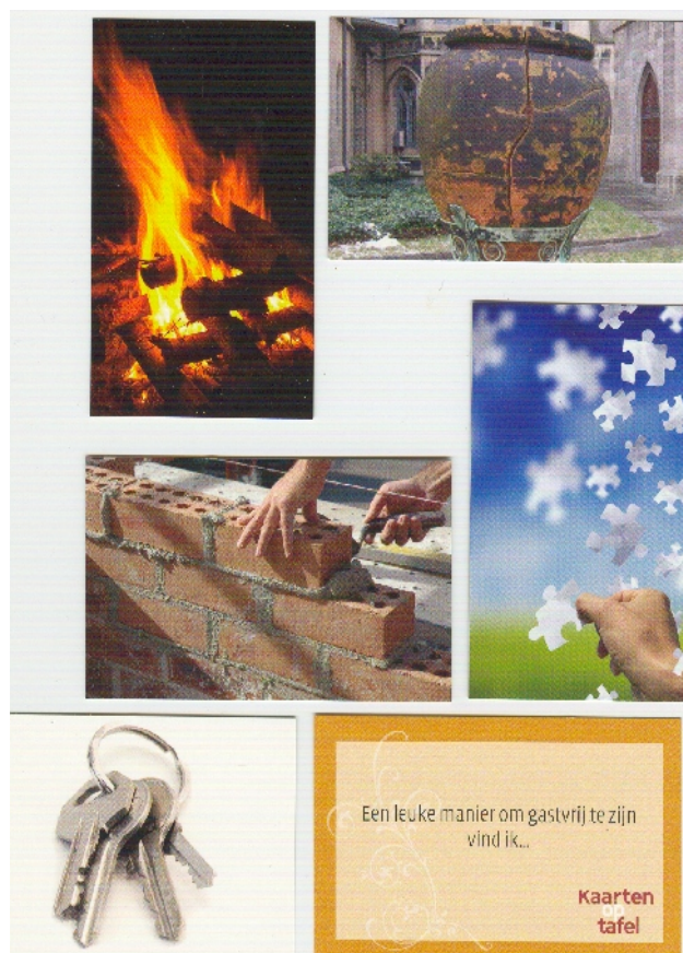
samen warmen, -eten, - werken, -spelen, de huissleutels geven

In de loop van het weekend kwam het een of andere beeld nog wel eens aan de orde en dan vooral als brug tussen onze meningen of opvattingen.